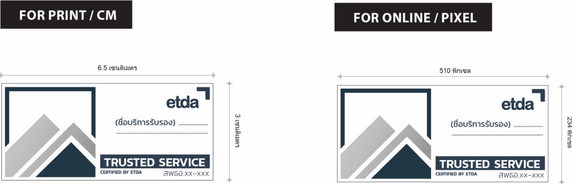
ภาพแสดงสัดส่วนการแสดงผลเครื่องหมายรับรอง